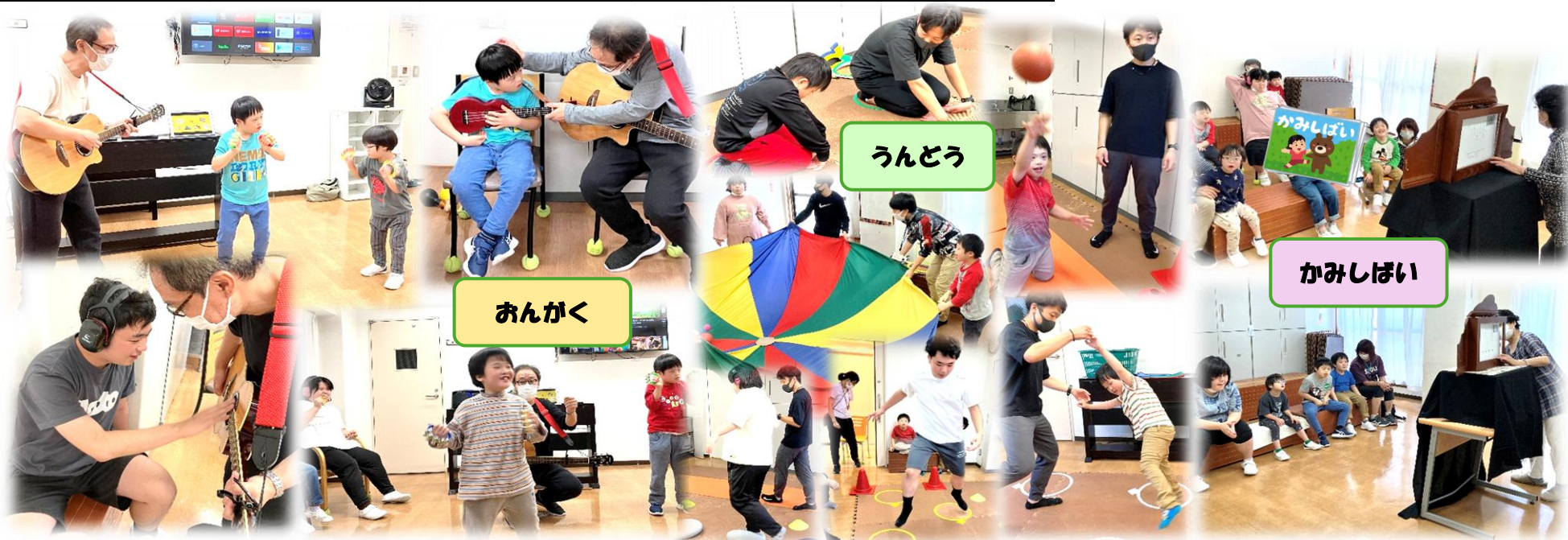
【承諾をいただいた方のみ、写真を掲載しています】

・支援専門スタッフによる「運動（火金）」 「音楽（木）」「美術（不定期）」活動を行います。 ・月に1回、専門家を招いて「紙芝居」の活動を行います。