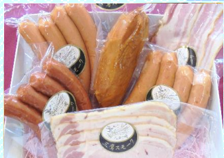
おまかせスモーク6種セット 商品番号 08 3,800円