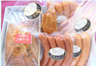
おまかせスモーク5種 &マフィンセット 商品番号 09 4,050円