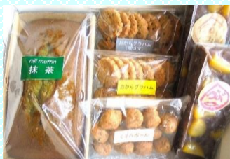
抹茶マフィン&クッキー3種 &栗蒸し羊羹セット 商品番号 01 3,070円