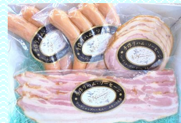
多摩のおみやげおまかせ セット 商品番号 11 1,900円