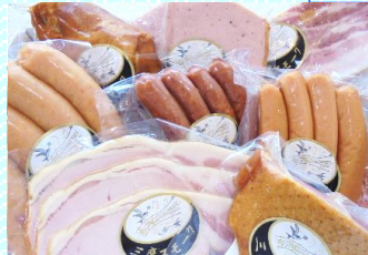
おまかせスモーク特選セット 商品番号 10 5,050円