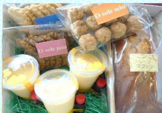
こだわりクリームチーズ 豆乳プリン&クッキー3種 &フルーツマフィンセット 商品番号 02 2,850円