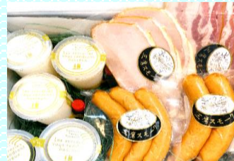
こだわりクリームチーズ 豆乳プリン&おまかせ スモーク4種セット 商品番号 04 3,500円