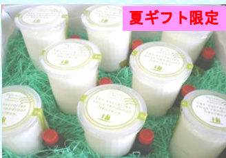
こだわりクリームチーズ豆乳プリン 商品番号 05 1,810円 商品番号 06 2,330円 商品番号 07 2,850円