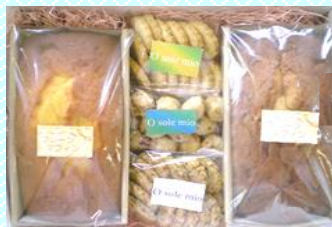
マフィン2本&クッキー3種 セット 商品番号 03 2,980円